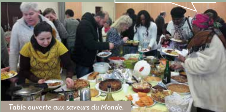
Table ouverte aux saveurs du Monde.

Passer ensemble, quelques dimanches par an, un moment de convivialité autour d'un repas partagé.