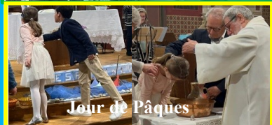
Jour de Pâques