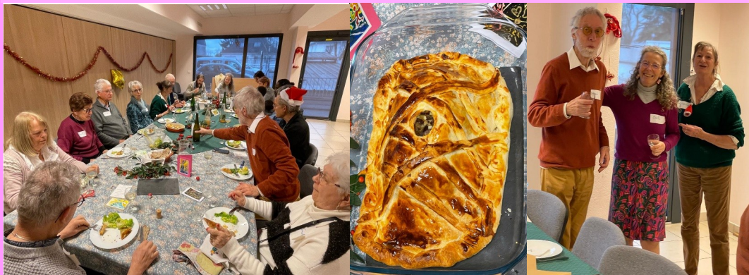
Table décorée, Koulibiac de saumon, buche glacée et pâtissière, cadeaux de Noël, atelier chant,...il y avait de l'ambiance à la salle St Vincent à Thouaré le jour de Noël!

Un temps festif et chaleureux qui a réuni 19 personnes souhaitant partager un moment convivial et fraternel. C'est en chansons que s'est conclue l'après-midi en chantant tous en chœur et en canon "J'aime l'ail", "J'ai du bon tabac" ou bien encore "Au gré du vent"!